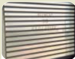
Beglazing van sectionele poorten